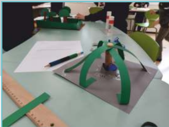
uitwerking idee voor fontein bij het nieuwe MFC door leerlingen van kindcentrum de Zevenster

De schoolkinderen fantaseren over een grote speeltuin, bioscoop, hertenkampen en winkels. De jongvolwassenen noemen met name het creëren van een centrumfunctie zoals woningbouw in combinatie met horeca/terras.